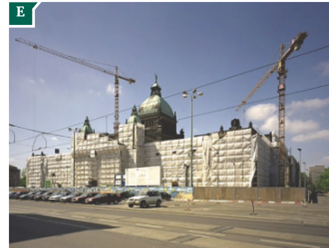
Photos historiques : A-C : Musée d'histoire de la ville de Leipzig D : Cour administrative fédérale E : Kunstmann, Krostitz